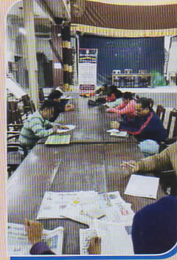
বিগত ২০শে ডিসেম্বর ২০২৪ গ্রন্থাগার দিবস উপলক্ষে পাঠাগারের সদস্য/সদস্যাদের জন্য আয়োজিত লিখিত কুইজ প্রতিযোগিতা।