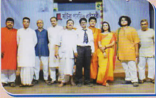
পাঠাগারের বার্ষিক উৎসব ও পুরস্কার বিতরণী সভা (৩০/০৩/২০২৫) উপলক্ষে পাঠাগারের সাধারণ বিভাগের সদস্য/সদস্যাবৃন্দ দ্বারা অভিনীত নাটকের কুশীলবগণ।