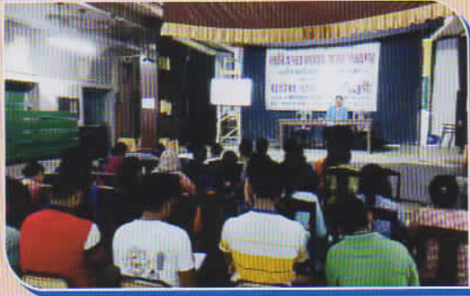
জাতীয় শিক্ষানীতি (NEP) অনুযায়ী নরসিংহ দত্ত কলেজের বাংলা বিভাগের ১৫ দিন ব্যাপী আবৃত্তি ও নাটকের গ্রীষ্মকালীন কর্মশালায় প্রশিক্ষকগণ।